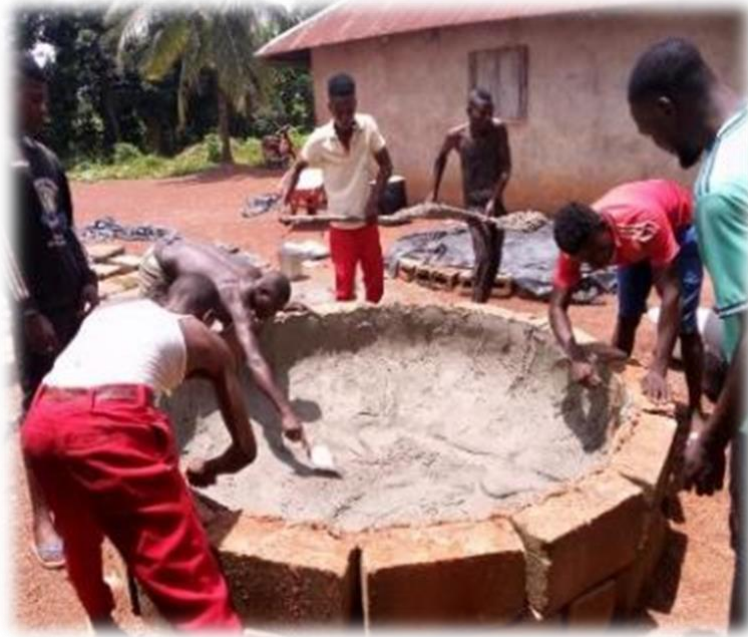
Training voor 5.000 liter cisterne

In 2017 werd dit project gestart. In 2022 werden 221 watertanks (cisternen) van 5.000 liter gebouwd. 102 mensen met een beperking (blind) en weduwen kregen een cisterne gratis. 17 metselaars (van wie 12 doof) werden getraind. 5 kleine cisternen werden gemaakt om handen te wassen in de coronapandemie. Deze werden uitgedeeld aan kerken, scholen en ziekenhuizen.