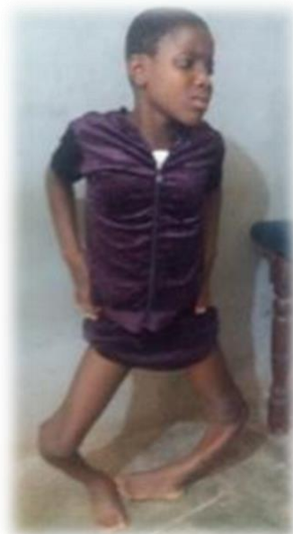
Voor de operatie

Een orthopeed bezocht CBR Effata in 2022 vier keer voor consultaties en operaties. In totaal zijn er 1.268 consultaties gedaan en 137 operaties (91 patiënten). 21 kinderen met hersenverlamming (cerebrale parese) hebben ondersteuning gekregen en 59 personen zijn geholpen met krukken en beugels. 8 personen kregen een rolstoel, 5 jongeren een kunstbeen. Per maand werden 44 personen behandeld met anti-epilepsie medicijnen.