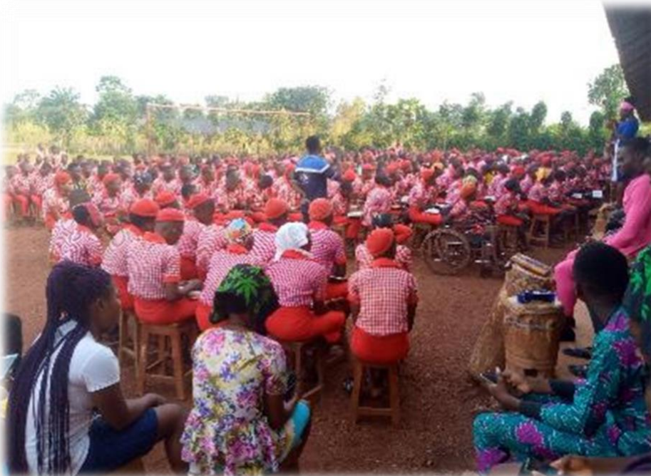
Dagopening Inclusieve Middelbare School "Berea"

In 2014 is de Inclusieve Middelbare School "Berea" gestart. Studenten met en zonder beperking zijn welkom op deze school om integratie te bevorderen. Eind 2022 waren er in totaal 504 studenten van wie 92 doof en 24 met een lichamelijke beperking. Vier leraren hebben een beperking.