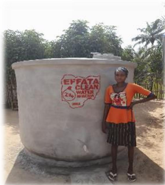
Blijde weduwe met water cisterne