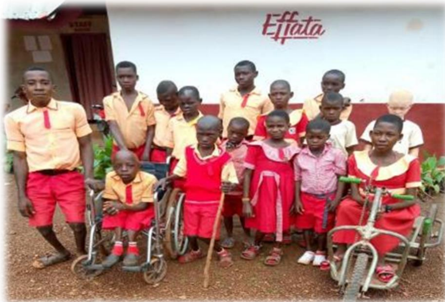
Aantal leerlingen van Inclusieve Lagere School "Bethel"

Deze school is gestart in 2010. In 2022 waren er in totaal 441 studenten, van wie 19 met een lichamelijke beperking en 42 weeskinderen uit het Aidsprogramma.