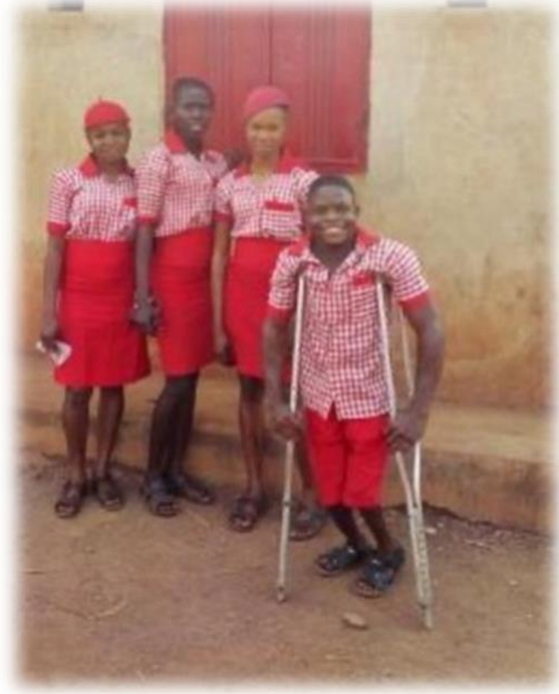
Op de middelbare school