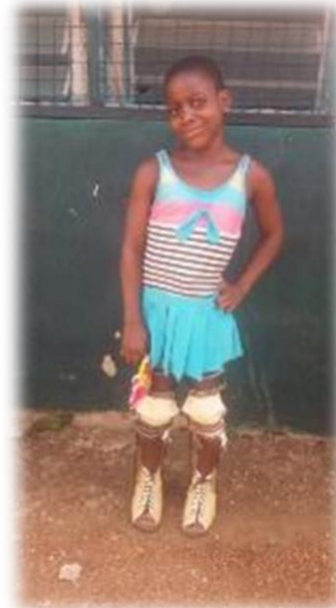
Na de operatie