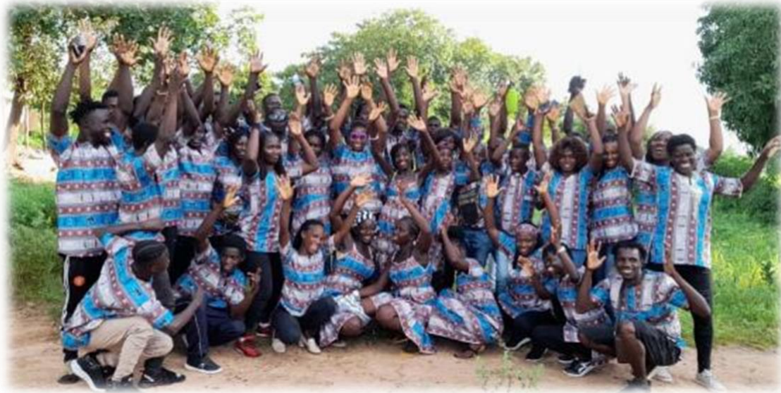
Aantal dove jongeren in Ingoré.