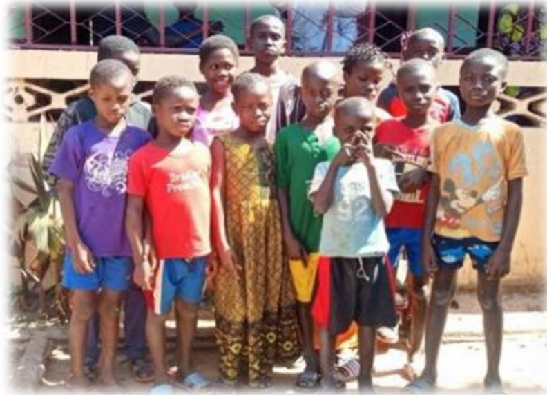
Nieuwe dove kinderen Ingoré

In 2014 werd een nieuw CBR-project gestart in Bissorã, het noorden van Guinee-Bissau. Guinee-Bissau is een van de armste landen ter wereld en heeft relatief hoge prevalentie wat betreft personen met een beperking. In 2019 verhuisde het project naar Ingoré. In 2022 werden meer dan 1.300 personen met een beperking geholpen met medicatie (zoals anti-epileptica), kunstledematen en rolstoelen. Ruim 130 jongeren werden financieel gesteund om naar school te gaan, waaronder 108 dove jongeren. 63 jongeren met een beperking leren een vak in de lokale gemeenschap (beroepstraining). 10 mensen met een beperking kregen een micro-credit. In samenwerking met een lokale organisatie werden 10 water cisternen (5.000 liter) gebouwd en 15 metselaars getraind.