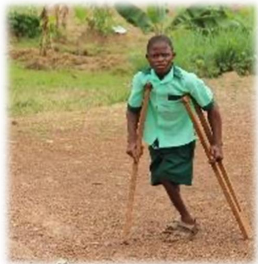
Op de lagere school