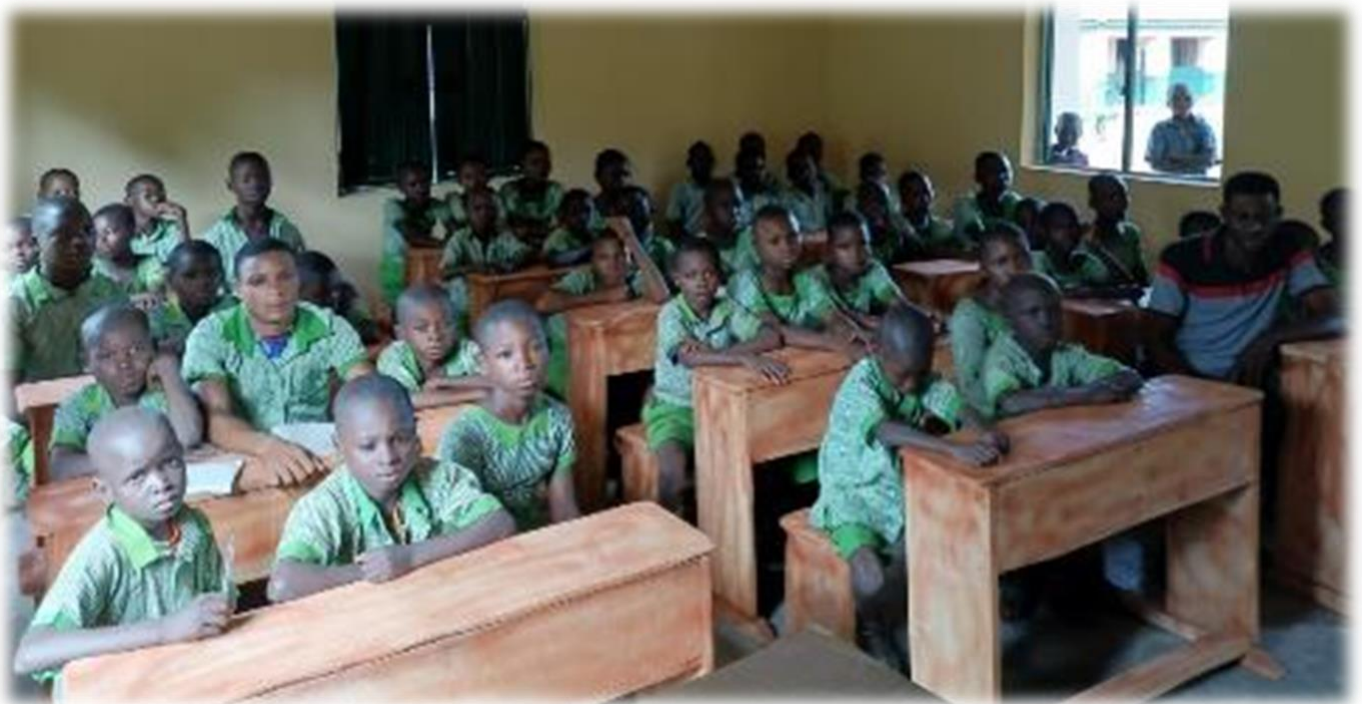
Leerlingen van Inclusieve Lagere School "Effata"

Vanaf 1999 geeft CBR Effata basisonderwijs aan kinderen met doofheid. In 2015 is het beleid veranderd. In plaats van "Speciaal Onderwijs" wordt "Inclusief Onderwijs" gegeven, wat betekent dat studenten met en zonder beperking samen les krijgen. Eind 2022 was het aantal kinderen 234, van wie 52 doof. Drie van de 17 leraren zijn doof.