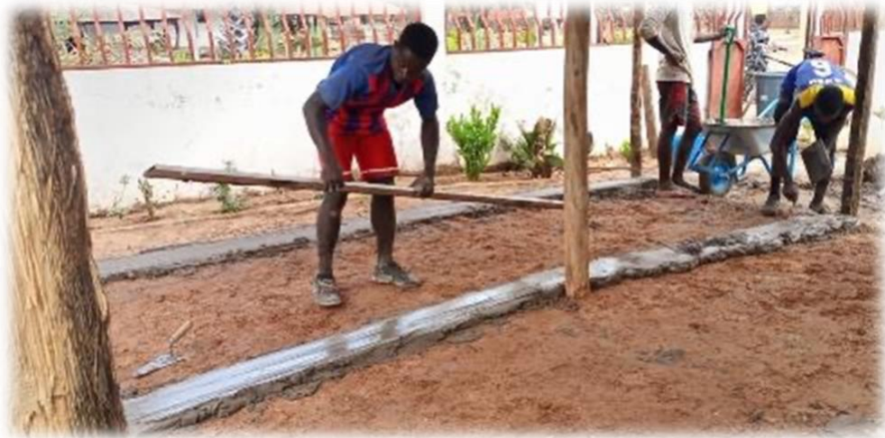
Dove metselaar Guinee-Bissau