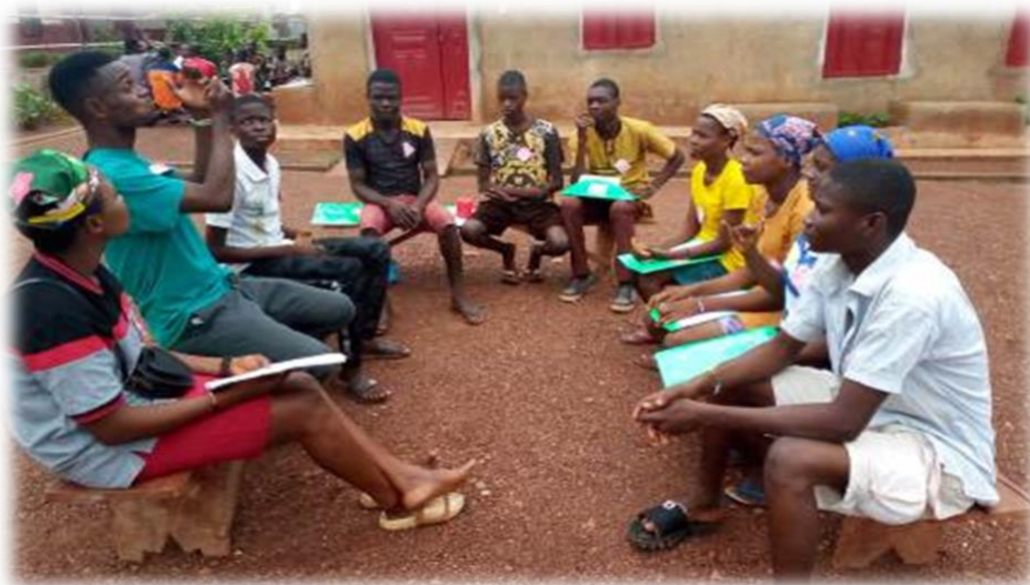
Bijbelstudie groep met doven in het jeugdkamp

AIDS Ministry is gestart in 2004. In 2022 werden er 893 Hiv-testen uitgevoerd. 72 mensen werden geholpen met Aidsremmers. 62 mensen kwamen elke maand naar de support-groep. 75 Aidswezen werden geholpen met scholing en levensonderhoud. 60 Aidswezen (tienerleeftijd) volgen een beroepstraining in Nwofe. Twintig ronden hun training af en werden vervangen door twintig nieuwe leerlingen. Een jeugdkamp werd gehouden met in totaal 270 tieners, van wie 112 met een beperking.